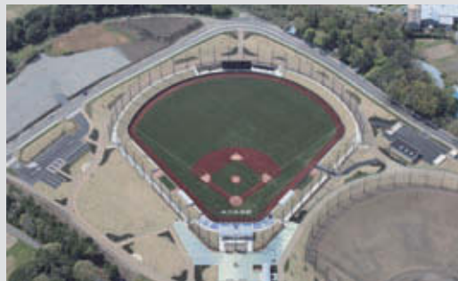
綾瀬スポーツ公園 竣 工：2013年2月 所 在 地：神奈川県綾瀬市