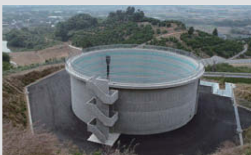
筑後川下流農業水利事業佐賀西部吐水槽 竣 工：2012年5月 所 在 地：佐賀県佐賀市