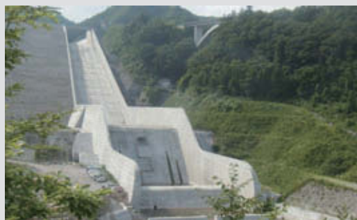
胆沢ダム洪水吐き 竣 工：2012年12月 所 在 地：岩手県奥州市