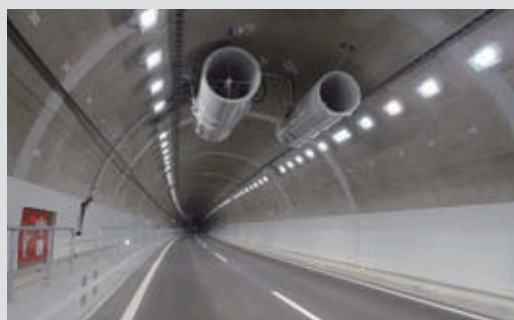
京都第二外環状道路西山トンネル 竣 工：2013年1月 所 在 地：京都府京都市西京区