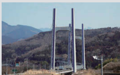
東名高速道路 東名足柄橋補修 竣 工：2013年3月 所 在 地：静岡県駿東郡小山町