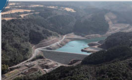
久木野尾ダム 竣 工：2012年5月 所 在 地：大分県杵築市