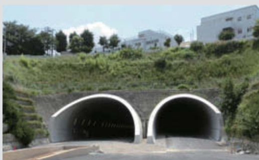
岸谷生麦線(国道1号行き)トンネル 竣 工：2012年8月 所 在 地：神奈川県横浜市鶴見区