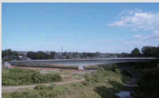
高瀬橋PCけた製作・架設 竣 工：2012年11月 所 在 地：東京都あきる野市