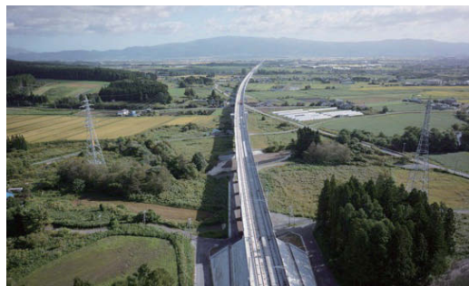
北海道新幹線 桜袋高架橋