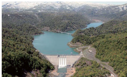
樺戸(二期)農業水利事業徳富ダム建設