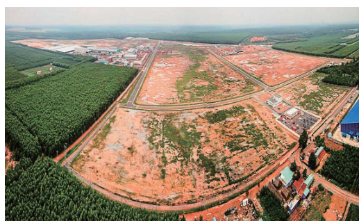
ロンドゥック工業団地インフラ工事パッケージP-1