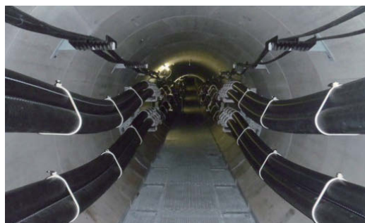
駿河東清水線新設の内安倍川横断洞道