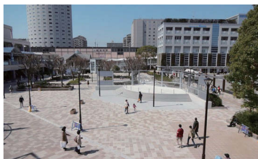
市道幹線9号道路災害復旧および復興交付金工事