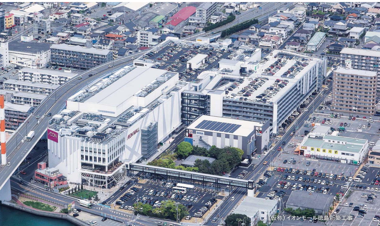
(仮称)イオンモール徳島新築工事

高度な技術力を駆使し、オフィスビルから文化・教育施設、商業施設、医療施設に至る多様な建築物の建設を手がけるとともに、企画設計段階から運営・メンテナンスまで、建物の生涯を通じたサービスの提供を実現しています。