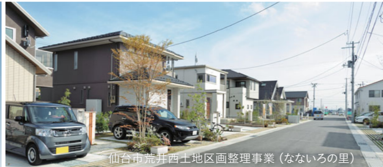
仙台市荒井西土地区画整理事業（なないろの里）