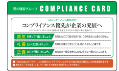
コンプライアンスカード

社是である「勇気、礼儀、正義」にもとづき「法令・倫理を守ることによって企業は持続的に発展する」というコンプライアンスに対する強い決意を込めて、「コンプライアンス基本方針」を定めています。また、社員がいつでも確認できるように、基本方針を記載した「コンプライアンスカード」を作成・配布し、全社員が携帯しています。